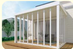
ガーデンルーム ジーマ(ルームタイプ)