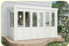
ガーデンルーム 暖蘭物語