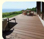
樹ら楽ステージ 木彫