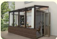
ガーデンルーム ココマ(ルームタイプ)